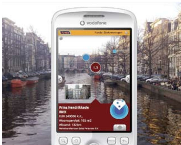
图2 利用增强现实技术测算与实物距离

现实技术的一个重要分支和发展，也是近年来的一项研究热点。增强现实主要是借助显示技术、交互技术、多种传感技术和计算机图形与多媒体技术将计算机生成的虚拟环境与用户周围的现实环境融为一体，使用户从感官效果上确信虚拟环境是其周围真实环境的组成部分 [23] 。例如，用手机摄像头拍摄天空，屏幕上会叠加一天的天气情况。拍摄某一名胜古迹，就可以获取相关信息等等。图2就是一个利用增强现实技术测算与实物距离的应用。